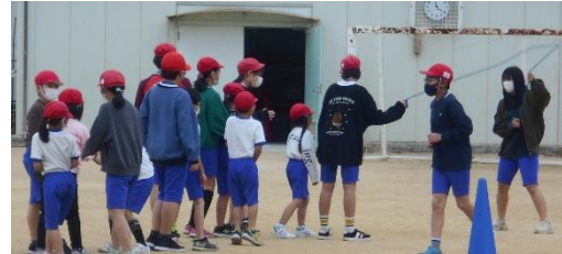
↓大なわ大会の様子→

休み時間や体育の時間に、練習からみんなで声を掛け合い、8の字跳びやくぐり抜け、ジャンプなどできることに取り組みました。また、今回は2年生と4年生、3年生と5年生、1年生と6年生の異学年で取り組むことにより、上級生がしっかりリードしている姿が随所で見られました。