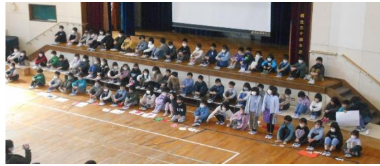
↑2年生学習発表会 ↓6年生参観・茶話会

また、6年生の茶話会では、保護者の皆さんが子どもたちを楽しませようと、1年生当時の写真と6年生の写真を貼って比べるコーナーや飾りつけなどの会場づくりから、お菓子やお玉りレールの企画などご準備をいただきました。子どもたちも楽しいひとときを過ごしていたと思います。本当にありがとうございました。