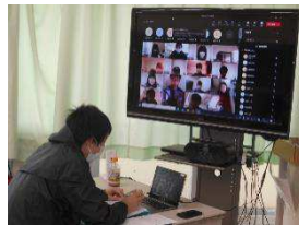
オンライン朝の会の様子↑

今年の冬は、新型コロナウイルス感染症に加え、インフルエンザの流行も危惧されています。また、感染性胃腸炎など、学校指定の伝染病の流行により、急に学級閉鎖や学年閉鎖になることがあります。そのような非常事態でもタブレットPCの活用により、できることは広がります。先日閉鎖した学級では、生活リズムを崩さないことを主旨として、オンライン朝の会の実施に加え、体調に合わせてできる課題をスクールタクトで配信しました。いざという時のために、使い方の確認をしておきましょう。