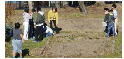
※中庭の畑の草取りの様子↑

環境美化委員会では、各学級の掃除用具の点検や植物の栽培、落ち葉拾いなど、学校の環境美化にかかる部分を担っています。先日寒い中、中庭にある畑の草取りなどを頑張ってくれていました。