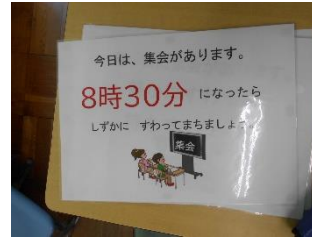
※集会委員会作成の静止画↑