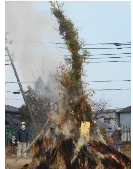
↑砂地区の大とんどの様子

1月7日(土)、岡部小学校の運動場で砂地区の「大とんど」がありました。お正月飾りの「門松」や「しめ飾り」は、一般的に1月7日までに片付けるものとされていますが、取り外した正月飾りを焼く行事を「とんど焼き」(地域によって言い方が異なります)といい、日本の伝統的な行事で、五穀豊穡、無病息災、家内安全を願います。