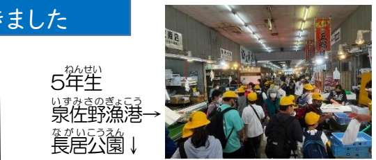
5年生 泉佐野漁港→ 長居公園↓