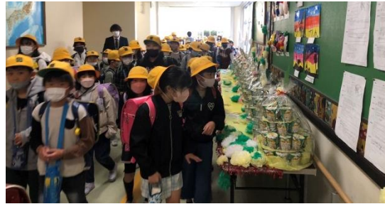
↑景品がきれいにディスプレイされています

11月12日(土)、土曜参観を実施しました。今回も密を避けるために2時間めと3時間めで分散参観という形をとらせていただきました。各学級では、参観当日に向けて、発表の練習や、タブレットPCを活用して調べ学習、意見を交わす場面の設定など、日頃