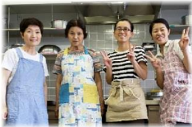
多笑食堂 スタッフのみなさん

地域のつながりが必要なのは子どもだけではないと気づき、どなたでも来ていただける場所として、また地域の子とも大人が出会いつながれる場所になればと思い「多笑食堂」と改名し活動しています。