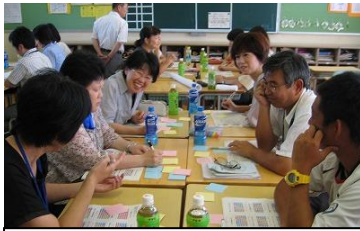
小中学校でグループ意見交流

が確認されました。「生徒が意欲的に参加できるように授業の改善を考えよう」「中学校での学習のつまづきを小学校に伝え、指導の重点化を図る」「宿題点検する方法を小中学校間で統一してみよう」「学校行事内容で小学校と同じ内容が重ならないよう情報交換を密にしよう」などが確認されました。