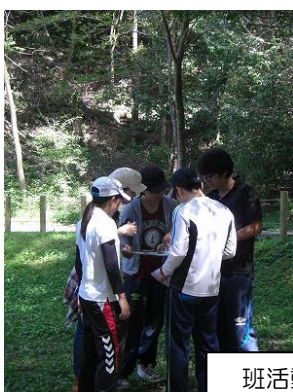
班活動 「どんぐり調査」へ