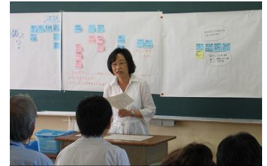
分科会でグループの発表

「宿題の出し方で、小学校中学校一貫した学習ノートを作ってみよう」「校則の指導について、小中学校間のギャップが少なくなるようにしよう」「9年間で目指す子ども像・つきたい力を決め、連携して育てよう」など、すぐにできそうなアクションプランが生まれています。今後、学校ごとでまとめられ小中一貫教育の具体的な取組みとなっていく予定です。