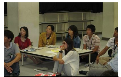
小学校グループ 段差を出し合おう

いて「小学校はていねいすぎる」「中学校は進度が早すぎる」。生徒指導では決められたルールについて「小学校では指導が甘い」「中学校では徹底して守らせる」など、お互いに日頃から気になっていたことが出されました。そのあと、その段差を解消するために小中学校が混合グループになって話し合い、共通理解として具体的に今後の取組み内容