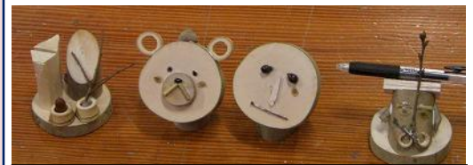
自然の材料を使った小物づくりの作品