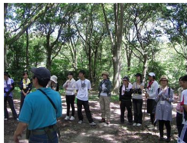
ガイドウォーク 「木の本数調査」へ