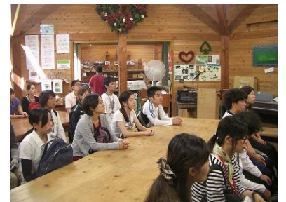
森の工作館 自然講義を聴きました