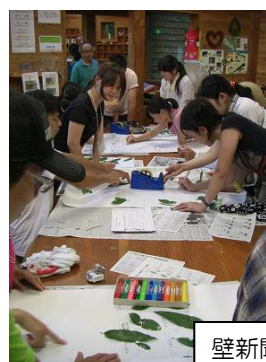
壁新聞づくり 3班は「どんころ新聞」