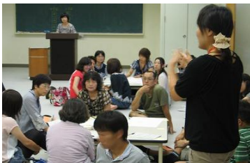
小中学校それぞれの意見交流

この夏、中学校区の教職員が一堂に会し、小学校6年間・中学校3年間で完結させるのではなく、義務教育期間9年間としての連続性に目を向け、子どもたちの発達段階に応じた系統性・継続性のある教育活動のあり方について意見交流が行われました。