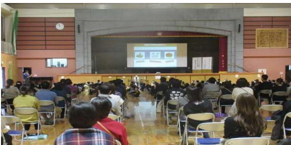
おや こ まな しょうさい こうえんかい 親と子どもの学びのために_PTA主催の講演会