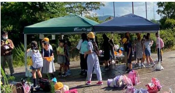
ねつちゆせいのよぼう ねつ みずとしゆわー 熱中症予防_夏のミストシャワー