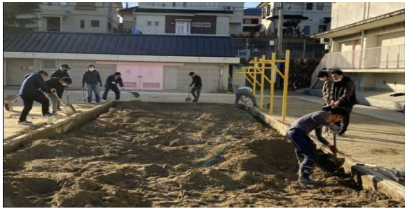
すなば みずは かいぜん こどもたち が つかい やすく する ため かいしゆ 砂場の水捌けの改善と子どもたちが使いやすくなるための改修