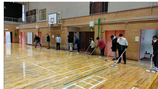
たいいくかん せんよう わくくす ひかひか 体育館_専用ワックスでピカピカに