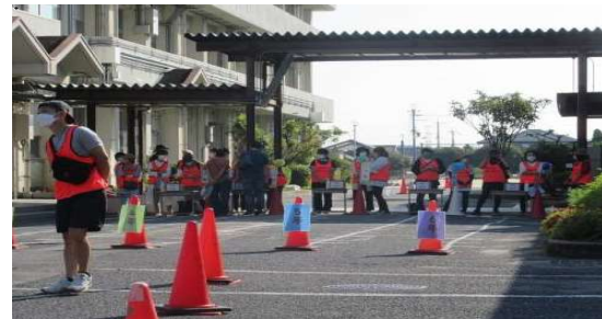
うんどうかいとうじつ うけつけ あうけい 運動会当日_受付の風景