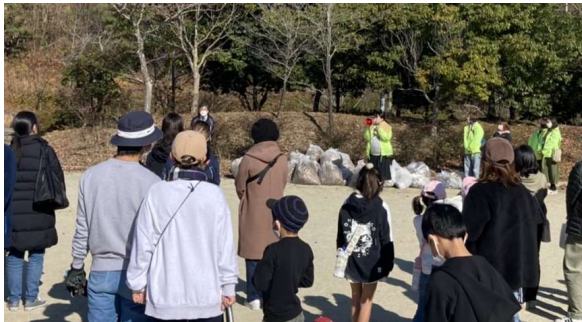
ちいまこつりゆう たわらちくびか くりーん さくせん 地域交流と田原地区美化のために_クリーン作戦