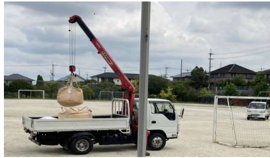
さじん とうけつぼうし こうてい ま 砂塵・凍結防止_校庭のにがり撒き