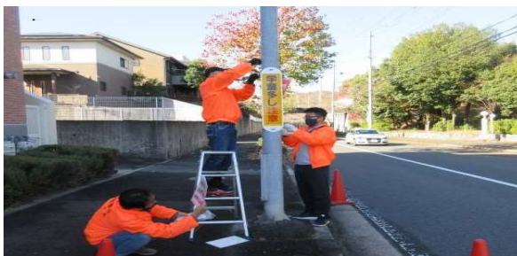
つうがくろ あんぜん かんばんほしゆ 通学路_安全のための看板補修