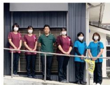
たにむら歯科口腔外科 スタッフのみなさん